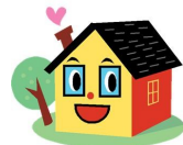
Gestor de casos