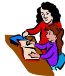
Instructor certificado en diabetes (CDE, siglas en inglés)