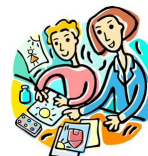
Trabajo social (SW, siglas en inglés)